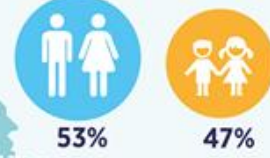
ВІКОВИЙ РОЗПОДІЛ ДЗВІНКІВ